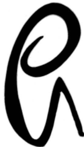
Graffitiversion zum Zeichnen oder für kleine Auflösungen