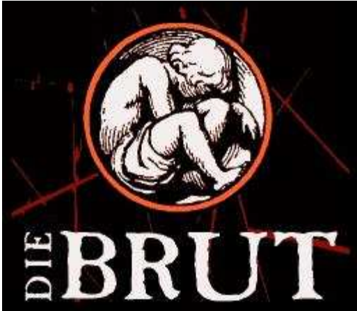
erste Version des Brütlings in 2D